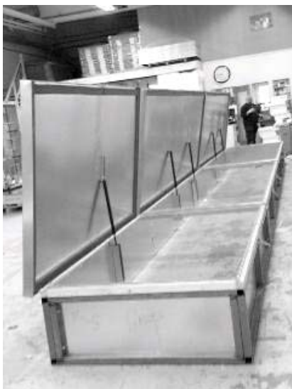
Specialtillverkad lucka, 10 x 1,2 meter med stålstomme.

Lock med gasfjädrar skall stängas på ett sådant sätt att man inte belastar locket snett.