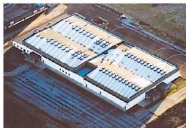
F-10 JAS-hangar, Ängelholm

Den största vi tillverkat hittills var 1,2 x 10 meter. Tre lock monterade på en stålstomme.