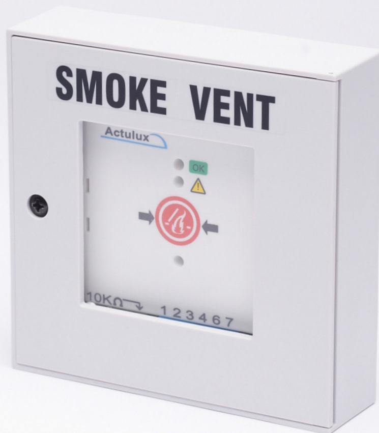
Brandtryckknapp, BVT (IP40) for Actulux smoke ventilation systems